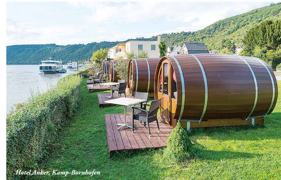
Hotel Anker, Kamp-Bornhofen