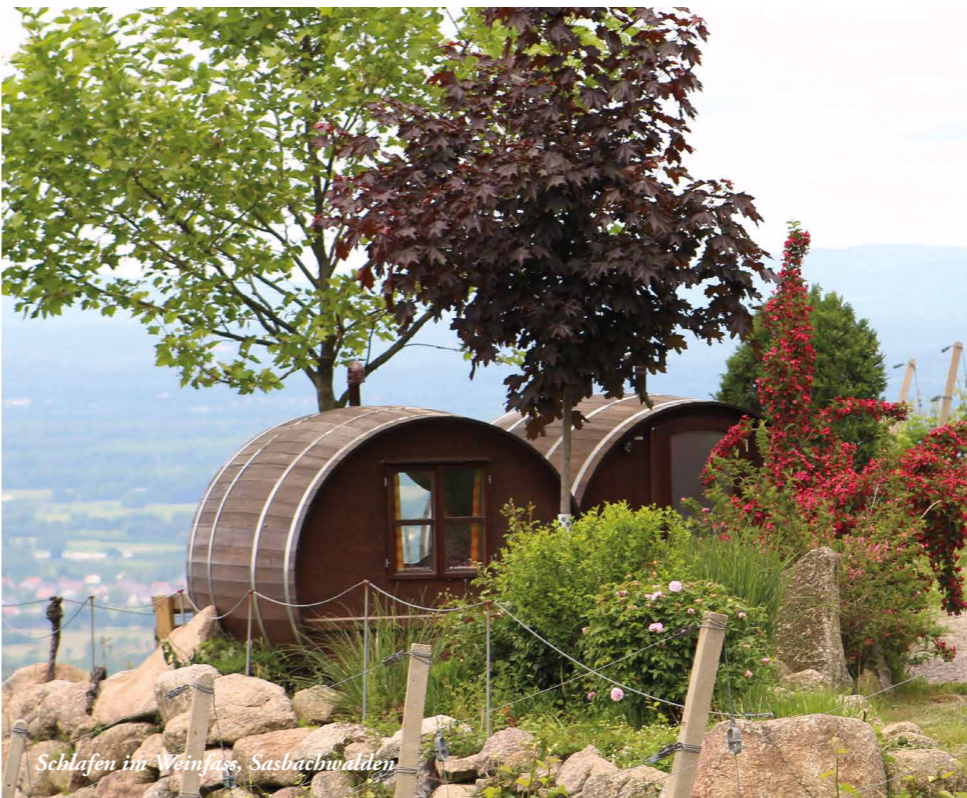
Schlafen im Weinfass, Sasbachwalden