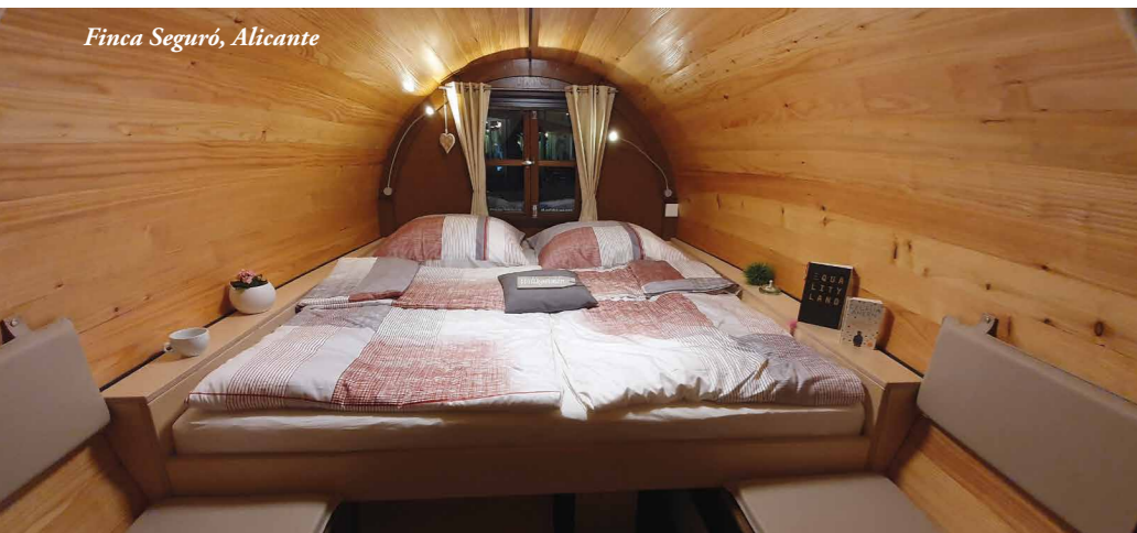
Finca Seguró, Alicante