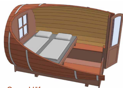
Querschläfer 2,75 m