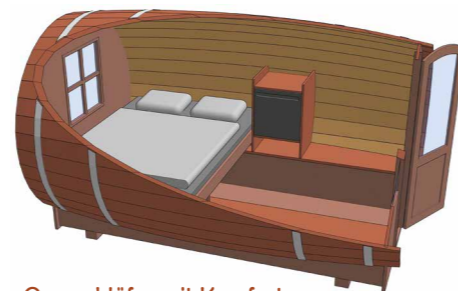
Querschläfer mit Komfort 3,25 m