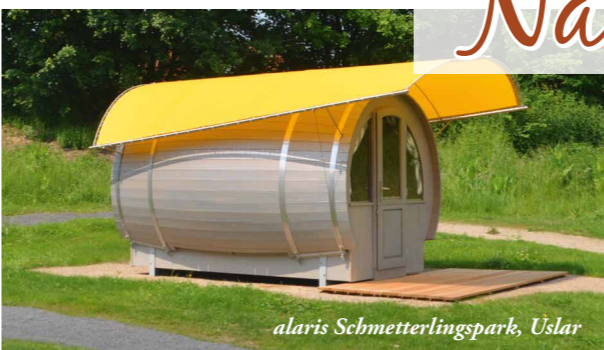
alaris Schmetterlingspark, Uslar